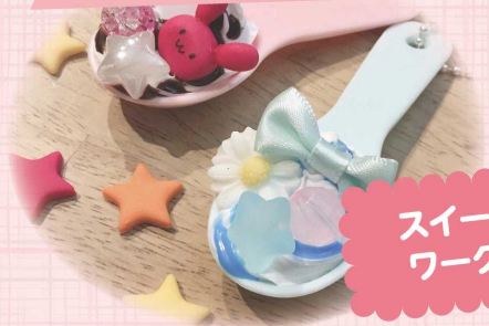
スイーツデコの ワークショップ