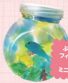
ぶぶぶボールや フィギュアを入れて、 自分だけの ミニ水族館を作ろう!