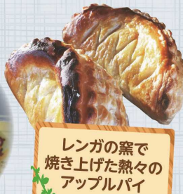
レンガの窯で 焼き上げた熱々の アップルパイ