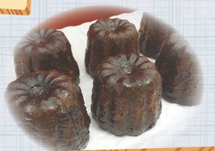
焼き立てカヌレ。 定番フレーバーと、 季節限定カヌレがあります。