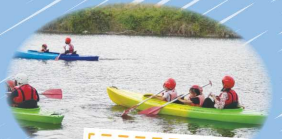
親子カヤック体験