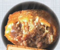
黒毛和牛を使用した スティック状の ミンチカツ