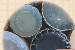
可愛い美濃焼食器 と雑貨