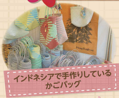
インドネシアで手作りしている かごバッグ