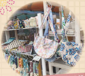
Bag・布小物・ ヘアアクセサリー・ 学校用品など