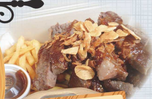
ガッツリ、 ステーキ弁当