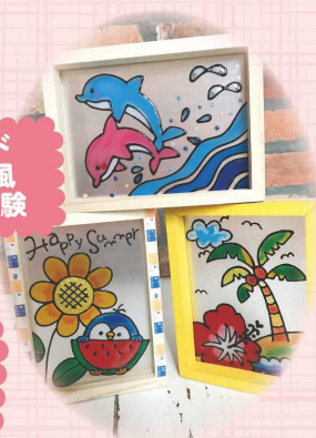
スタンド グラス風 アート体験