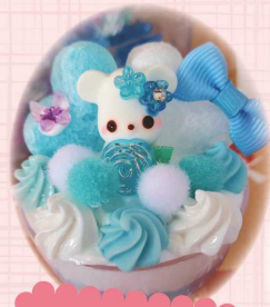
かわいい動物や パーツで作る ミニチュア作り