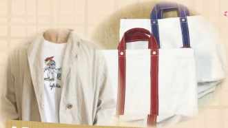
岡山倉敷産の帆布や デニムを使った カバンや衣類