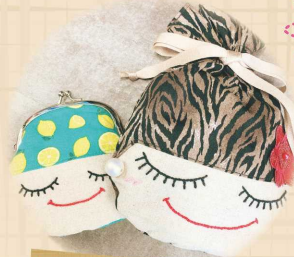
オリジナル キャラクター (レディちゃん)雑貨