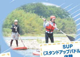
SUP (スタンドアップパドルボード) 体験