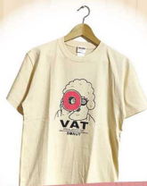
手作業でプリントした オリジナルシャツ