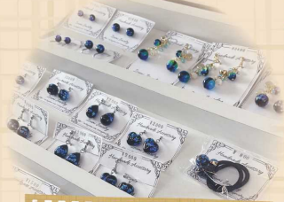
沖縄ホテルガラス アクセサリー