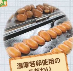
濃厚若卵使用の こだわり ベビーカステラ