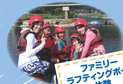
ファミリー ラフティング 体験