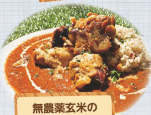
無農薬玄米の こだわり スパイスカレー