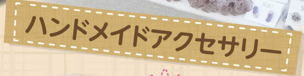
ハンドメイドアクセサリ