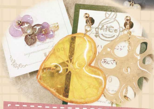
本物のお花のアクセサリー、 本物の食べ物アクセサリー