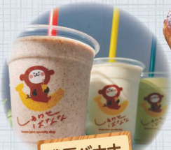
濃厚バナナ ジュース