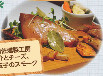
日和佐燻製工房 魚介とチーズ、 半熟玉子のスモーク